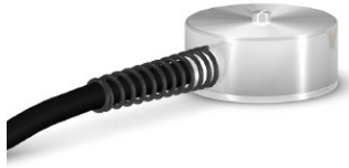
Druckkraftaufnehmer Load Cell

Diese Kraftaufnehmer sind dank ihrer kompakten Bauform für Messungen in beengten Einbauverhältnissen bestens geeignet. Die Kraftaufnehmer benötigen lediglich eine ebene Fläche als Untergrund. Die Kräfteinleitung erfolgt zentral über eine ballige Kontur, die geringe Schiefstellungsfehler verzeiht.